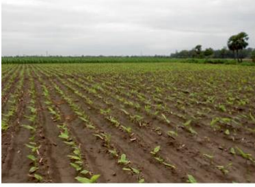
मेड और फरो विधि