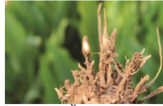
जड़ों पर गाल्स