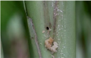
स्यूडोस्टम पर बोर-होल

प्ररोह बेधक ( कोनोगीथस पंक्टिफेरालिस ) हल्दी का सबसे गंभीर कीट है। लार्वा छद्म तनों में छेद करते हैं और आंतरिक ऊतकों को खाते हैं। छद्म तने पर एक बोर-होल के माध्यम से फ्रास बाहर निकल जाता है और मुरझाया हुआ केंद्रीय अंकुर कीट के संक्रमण का एक विशिष्ट लक्षण है। वयस्क मध्यम आकार का होता है जिसके पंखों का फैलाव लगभग 20 मि. मी. होता है। पंख छोटे काले धब्बों के साथ नारंगी-पीले रंग के होते हैं। पूर्ण विकसित लार्वा विरल बालों के साथ हल्के भूरे रंग के होते हैं।