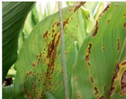
पर्ण चित्ती रोग

पर्ण चित्ती कोलेटोट्राइकम कैप्सीसी के कारण होता है। यह रोग नई पत्तियों की ऊपरी सतह पर विभिन्न आकार की भूरी चित्ती के रूप में प्रकट होता है। चित्ती आकार में अनियमित और बीच में सफेद या भूरी रंग की होती हैं। बाद में, दो या दो से अधिक चित्तियां आपस में जुड़ सकती है और लगभग पूरी पत्ती को ढकने वाला एक अनियमित पैच बना सकते हैं। प्रभावित पत्तियां अंततः सूख जाती हैं। प्रकंद ठीक तरह से विकसित नहीं होते हैं।