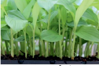
एकल कली अंकुर