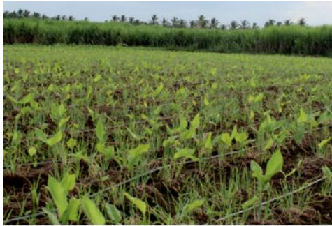
हल्दी में ड्रिप सिंचाई

सिंचित फसल के मामले में, मौसम और मिट्टी की स्थिति के आधार पर, चिकनी मिट्टी में लगभग 15 से 23 सिंचाई की आवश्यकता होती है। रेतीली दोमट मिट्टी में, सिंचाई की पारंपरिक सिंचाई को 40 बार तक की आवश्यकता हो सकती है। पानी की उपलब्धता के आधार पर, प्रतिदिन या वैकल्पिक दिनों में, बूंद-बूंद सिंचाई भी की जा सकती है।