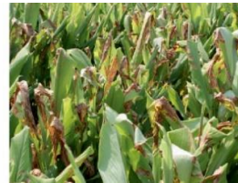
धब्बे बनाने वाली पर्ण चित्तियां