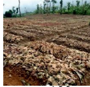
उठायी क्यारी विधि