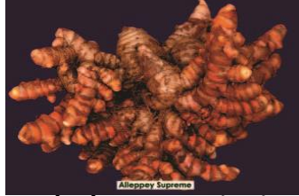
आईआईएसआर आलप्पी सुप्रीम