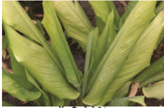
पत्तों की रोसेटिंग