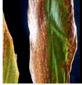
पत्ती धब्बा रोग

पत्ती धब्बा टफ्रीना मैक्युलन्स के कारण होता है। प्रारंभिक लक्षण पत्तियों के दोनों ओर छोटे, अंडाकार, आयताकार या अनियमित भूरे रंग के धब्बे के रूप में प्रकट होते हैं, जो जल्द ही गंदे पीले या गहरे भूरे रंग के हो जाते हैं। पत्तियां भी पीली हो जाती हैं। गंभीर मामलों में पौधे झुलसे हुए दिखाई देते हैं और प्रकंद की उपज कम हो जाती है।