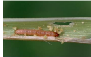
प्ररोह बेधक लार्वा