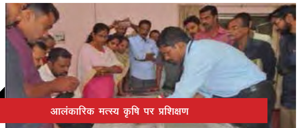
आलंकारिक मत्स्य कृषि पर प्रशिक्षण

कृषि विज्ञान केन्द्र द्वारा विभिन्न विषयों पर कुल 21 प्रशिक्षण कार्यक्रम आयोजित किया गया जिससे 856 प्रतिभागियों ने लाभ उठाया। इसमें पादप प्रवर्धन तकनीकियां, झाडी काली मिर्च उत्पादन, केला में आईपीडीएम, बकरी पालन, पशुओं का रोग एवं उसका नियन्त्रण उपाय, आलंकारिक मत्स्य कृषि एवं आईएफएस, कटहल संसाधन, साबुन निर्माण, अदरक एवं हल्दी की बोनसाई निर्माण कृषि पद्धतियां, आलंकारिक मत्स्य कृषि, खारा पानी मत्स्यपालन आदि विभिन्न पहलुएं शामिल थे। नारियल विकास बोर्ड द्वारा दिनांक 25-30 जून 2018 की अवधि में कृषि विज्ञान केन्द्र में केरमित्र पर एक वोकेषनल प्रशिक्षण आयोजित किया जिसमें 17 प्रशिक्षार्थियों ने भाग लिया।