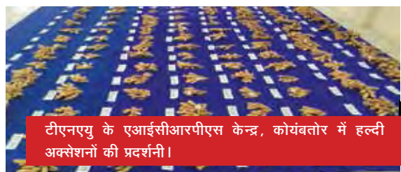
टीएनएयु के एआईसीआरपीएस केन्द्र, कोयंबतूर में हल्दी अक्सेशनों की प्रदर्शनी।

हल्दी के दो सौ पचहत्तर अक्सेशनों को एआईसीआरपीएस के टीएनएयु, कोयंबतूर केन्द्र के हल्दी जर्मप्लासम से फसलन किया और किसानों एवं छात्रों के लिए उसका प्रदर्शन किया गया।