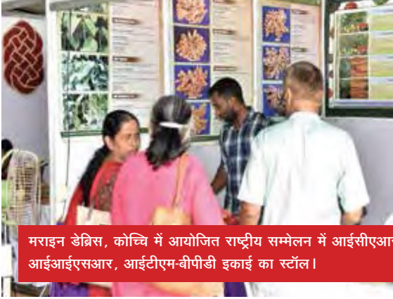
मराइन डेब्रिस, कोच्चि में आयोजित राष्ट्रीय सम्मेलन में आईसीएआर-आईआईएसआर, आईटीएम-बीपीडी इकाई का स्टॉल।