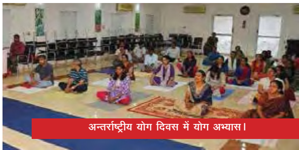
अन्तर्राष्ट्रीय योग दिवस में योग अभ्यास।

भाकृअनुप-आईआईएसआर, क्षेत्रीय स्टेशन, अप्पंगला, प्रायोगिक प्रक्षेत्र एवं कृषि विज्ञान केन्द्र, पेरुवण्णामुषि में भी अन्तर्राष्ट्रीय योग दिवस मनाया गया।