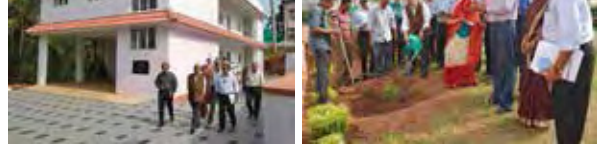
आईसीएआर-आईआईएसआर में उप महानिदेशक का भ्रमण।