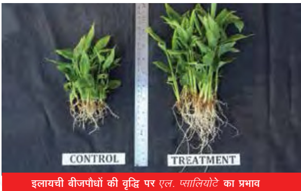
इलायची बीजपौधों की वृद्धि पर एल. प्सालियोटे का प्रभाव

लेकानिसिलियम प्सालियोटे, एक कीटाणुनाशक सूत्रकृमि है जिसको पहले ही इलायची शिप्स, सयोथिप्स कारडमोमी के संवाहक के रूप में देख लिया उसने इलायची (एलटारिया कारडमोमम) में पादप वृद्धि बढाया। इस कवक ने पादप वृद्धि बढाने में इन्डोल -3 एसिटेट एसिड तथा अमोणिया के उत्पादन द्वारा तथा अजैविक फोस्फेट सोल्यूबिलाइसिंग और जिंक द्वारा सीधे प्रदर्शित किया। इसने अप्रत्यक्ष रूप से भी साइडरोफोर्स का उत्पादन करके, सेल वाल डीग्रेडिंग एनजाइम जैसे \alpha -अमैलेस, सेल्लुलोस तथा प्रटेयस द्वारा पादप वृद्धि बढाने में अपना अंक अदा किया है। पोट कल्चर परीक्षण में इस कवक को इलायची बीजपौधे के मूल क्षेत्र में प्रयोग करने पर प्ररोह एवं जड़ों की लंबाई, प्ररोह एवं जड़ों का बयोमास, अप्रधान जड़ों एवं पत्तों की संख्या एवं पत्तों में क्लोरोफिल की मात्रा अनुपचारित पौधों की अपेक्षा बढ रही। यह इस कवक का पादप वृद्धि बढाने का पहला रिपोर्ट है। इसकी उपलब्धियों को माइक्रोबायोलोजिकल रिसर्च जर्नल में प्रकाशित किया।