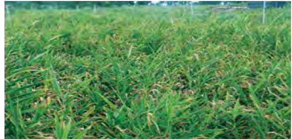
करनाटक में पर्ण ब्लाइट रोग बाधित अदरक खेत।

अदरक के पर्ण ब्लाइट जिसकी विशेषता लाल भूरे रंग के घाव होते हैं जिसे, करनाटक के मैसूर, कामराजनगर तथा उत्तर कन्नडा जिलों में तथा केरल के वयनाडु एवं कोषिकोड में वर्ष 2016 तथा 2017 में आयोजित विस्तृत सर्वेक्षण के दौरान देखा गया था। इसका आपतन 0-40 प्रतिशत होता है। इसका लक्षण अदरक के पत्तों पर लाल भूरे रंग के अंडाकार के पानी भरी हुई चित्तियां हैं जो अदरक की पत्तियों के पटल के सीमांत और बाहर के अंत पर पीले प्रभामंडल के साथ विच्छेदित धब्बे होते हैं। बाद में यह धब्बे धीरे धीरे बढ़कर कभी संगठित होकर बड़े रंगहीन क्षेत्र बनता है जो अंत में पूरे पत्ते के ब्लाइट का कारण होता है। कवक वियुक्तियों के कारण होनेवाले पर्ण ब्लाइट को कोनिडियल रूप विज्ञान एवं आणविक चरित्रांकन के आधार पर बाइपोलारिस रोस्ट्राटा (ड्रेक्स) धूमैकर (पर्याय: एक्सरोहाइलम रोस्ट्राटम) के रूप में पहचान किया गया। यह अदरक के पर्ण ब्लाइट के कारक बी. रोस्ट्राटा की नई रिपोर्ट है।