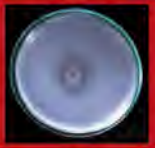
ए) मीथाइलोबैक्टीरियम कोलनीस तथा बी) मीथाइलोबैक्टीरियम स्पीसीस का फोस्फाटेस क्षमता

पादप वृद्धि के लिए वैनिला से संबन्धित एन्डोफाइटिक जीवाणुओं की छान बीन