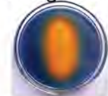
साइडरोफोर क्षमता दिखाने वाली वी आर ई एन 1 वियुक्ती

पादप वृद्धि के लिए वैनिला से संबन्धित एन्डोफाइटिक जीवाणुओं की छान बीन