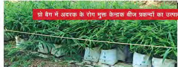
ग्रो बैग में अदरक के रोग मुक्त केन्द्रक बीज प्रकन्दों का उत्पादन

बी पी डी इकाई बड़ी मात्रा में रोग मुक्त बीज सामग्रियों का उत्पादन करने के लिए ग्रो बैग में एक ही मुकुल वाले बीजों या प्रो-ट्रै बीज पौधों को लगाकर अदरक के विमोचित प्रजातियों के केन्द्रक बीज प्रकन्दों का उत्पादन करने लगे।