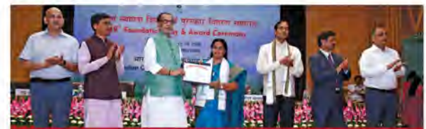
फार्म मशीनरी का उन्नयन एवं अनुसंधान के लिए 16 जुलाई 2017 को एन ए एस सी कोम्लक्स, नई दिल्ली में आयोजित आई सी ए आर - स्थापना दिवस समारोह में एन ए एस आई-आई सी ए आर पुरस्कार।