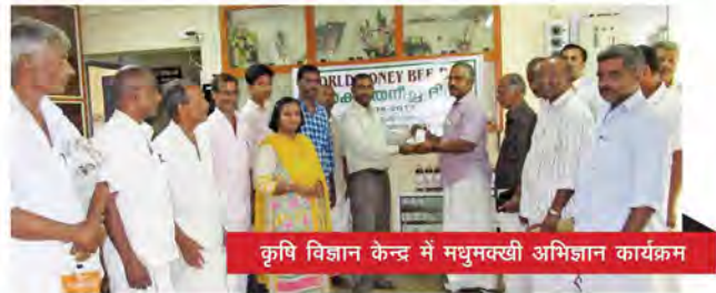
कृषि विज्ञान केन्द्र में मधुमक्खी अभिज्ञान कार्यक्रम

विश्व मधु दिवस (19 अगस्त 2017) : स्कूल छात्रों तथा पूर्व प्रशिक्षुओं के लिए मधुमक्खी पालन पर एक अभिज्ञान कार्यक्रम आयोजित किया जिसमें कुल 85 प्रतिभागियों ने भाग लिया। इस अवसर पर मधु उत्पादन एवं विपणन से जुड़े किसान-उत्पादक दल का गठन किया गया।