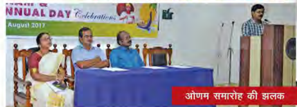
ओणम समारोह की झलक