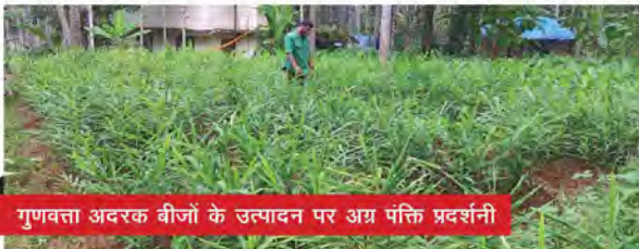
गुणवत्ता अदरक बीजों के उत्पादन पर अग्र पंक्ति प्रदर्शनी

उच्च उत्पादन क्षमता वाले हल्दी प्रजाति आई आई एस आर प्रगति की अग्र पंक्ति प्रदर्शनी तथा स्वस्थ अदरक बीजों के उत्पादन पर प्रदर्शनी की भी किसानों के खेत में प्रगति हो रही है।