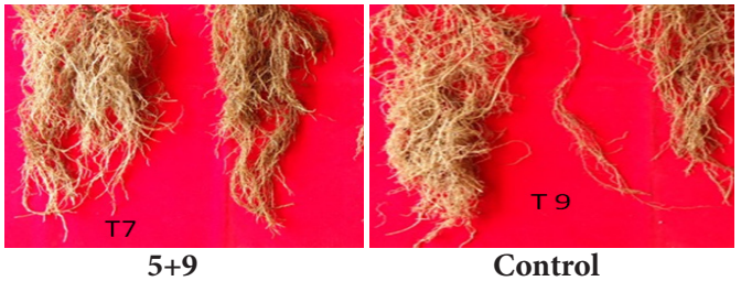
एक्टिनोमाइसेट्स कनसोर्टिया द्वारा पादप वृद्धि