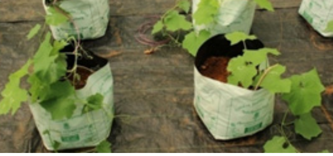
बीज आवरण तकनीक द्वारा सब्जियों को उत्पादन