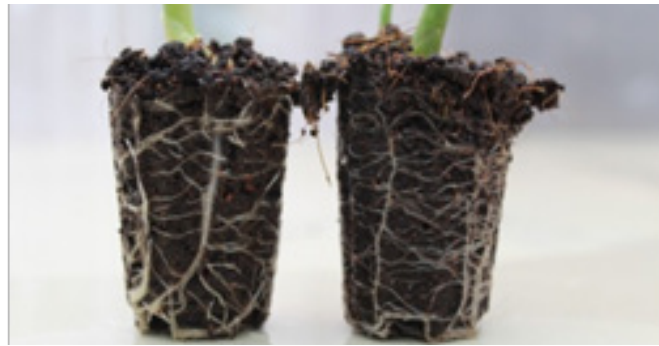
अदरक की रोपण सामग्रियों का उत्पादन