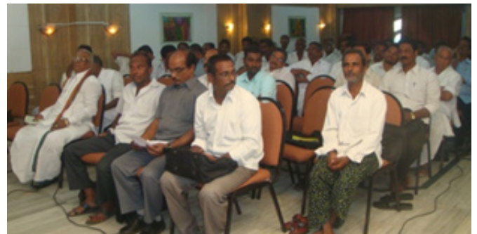
विस्तार कार्मिकों के लिये आयोजित प्रशिक्षण