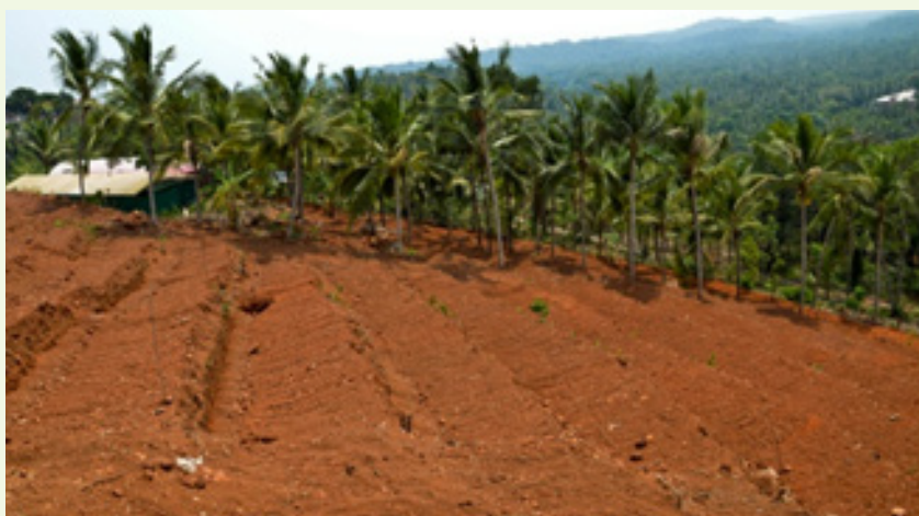
मुख्यालय चेलवूर कैम्पस में खेत परीक्षण हेतु तैयार भूमि

मुझे प्रसन्नता है कि वर्ष 2014 की अच्छी शुरुआत हुई है। मुख्यालय में खेत परीक्षण हेतु अदरक एवं हल्दी की 500 से अधिक बेडों के लिये भूमि को तैयार करके हमने अपने सपने को साकार किया है। इसके अतिरिक्त, यहां मसालों की जैविक खेती तथा वृक्ष मसालों जिसमें दालचीनी भी शामिल है, को प्रदर्शन हेतु स्थापित किये गये। जबकि संस्थान में बुनियादी सुविधायें जैसे, तीव्र गतिशील आंकड़े केन्द्र को फाइटोफ्यूरा के माध्यम से तथा आधुनिक डाईनिंग सुविधा को बी पी डी के माध्यम से विकसित की गयी। इसके अतिरिक्त प्लग ट्रे तथा लंबी पंक्तियों द्वारा काली मिर्च कतरनों की द्रुत गुणन तकनीक को किसानों, उद्यमियों, मसाला विशेषज्ञों तथा अन्य से अच्छी प्रतिक्रिया प्राप्त हुई। व्यापार की दृष्टि से, हमने अपनी विकसित प्रजातियों तथा सूक्ष्मपोषण संयोजनों को लाइसेंसिंग किया। इन उपलब्धियों को अच्छी शुरुआत के रूप में या हमारे परिश्रम की सफलता के रूप में देख सकते हैं। यद्यपि यह अभी शुरुआत हुई है, परन्तु हमारी कर्तव्यनिष्ठता तथा कठिन परिश्रम महत्वपूर्ण तकनीकियों को विकसित करने के लिये हमें आवश्यक प्रेरणा प्रदान करेगी। हमने अपने अधिदेश फसलों पर अधिक सूचनायें संचित की है तथा अब इन सूचनाओं को उचित ढंग से भाषांतरित करके, उचित तकनीकियों को विकसित करके उन्नत जर्नलों में प्रकाशित कर सकते हैं। आरथर सी लारक के कथनानुसार अपूर्ण डेटा कभी ज्ञान नहीं होता, ज्ञान कभी विवेक नहीं होता तथा विवेक कभी पूर्वज्ञान नहीं होता।