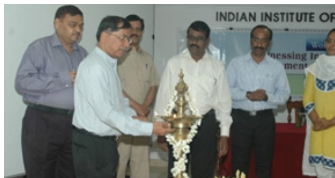
आई पी आर कार्यशाला का उद्घाटन सत्र