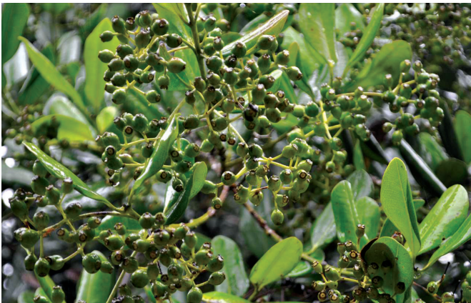
अप्पंगला में अधिक फल युक्त आलस्पाइस पेड