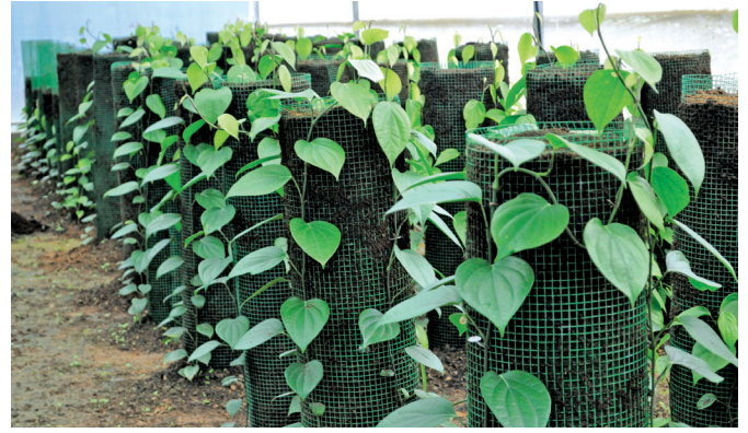
अप्पंगला में कोलम में काली मिर्च का उत्पादन