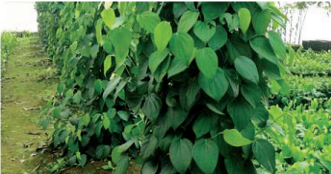
पेरुवण्णामुषि फार्म से कोलम विधि द्वारा काली मिर्च की रोपण सामग्री का उत्पादन

आई आई एस आर पार्म पेरुवण्णामुषि के जननद्रव्य पौधशाला में एक पोलीहाउस के अन्दर नौ कोलम की स्थापना करके अक्तूबर 2014 को प्रत्येक कोलम में काली मिर्च की एक प्रजाति का रोपण किया गया। अब तक इन नौ कोलम से कुल 345 शीर्ष प्ररोह, 165 लेटरल्स, 445 एक नोड वाली कतरनें प्राप्त हुईं। इन प्रजातियों में श्रीकरा, शुभकरा, आई आई एस आर थेवम, आई आई एस आर मलबार एक्सल, आई आई एस आर गिरिमुंडा, पौर्णमी, पंचमी, आई आई एस आर शक्ति तथा पी एल डी -2 शामिल हैं।