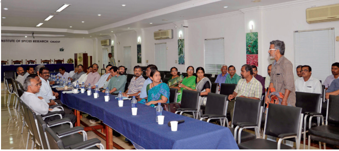
एस. एस. एम. के. की बैठक

संबन्ध, विज्ञान प्रदर्शन एवं प्रदर्शनियों द्वारा विज्ञान को लोकप्रिय करना है। उत्तर केरल के विभिन्न संस्थानों में विज्ञान के विभिन्न पहलुओं पर एक सैटलाइट संगोष्ठी का आयोजन करने पर विचार किया गया।