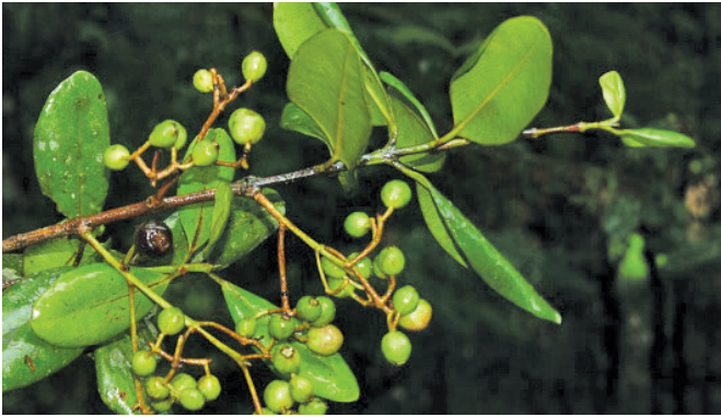
पेरुवण्णामुषि फार्म में आलस्पाइस की फल सजावट

क्षेत्रीय स्टेशन में, आलस्पाइस पौधे तथा कई फूलों का उत्पादन किया तथा सभी पौधों में कई फल को अंकित किया। पिछले मौसम में शाखाओं को काटने पर वृक्ष फल में वृद्धि अंकित की गयी।