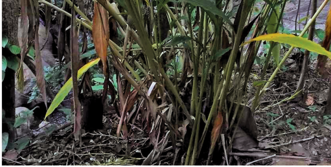
इलायची का नया अक्सेशन

काली मिर्च के 38 कल्टिवेटड अक्सेशनों को केरल के कोट्टयम जिले से संचित किया गया जिसमें विख्यात कल्टिवर जैसे, नारायकोटी, पेरुमकोटी, कुरियलमुंडी, नीलमुंडी, चोलमुंडी तथा नेटुमचोला शामिल हैं। छोटी इलायची का एक अक्सेशन (मलबार प्रकार) को इदुक्कि जिले के कन्निर एलम ग्रोयिंग ट्रेक्ट्स, मोरकाड, तोटुपुषा सं संचित किया गया।